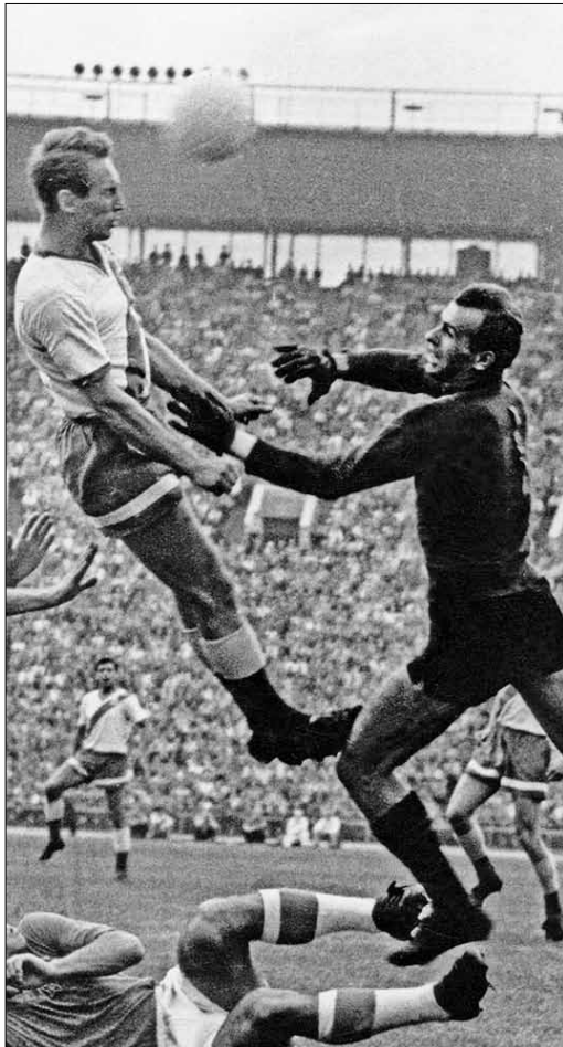
Бомбардир. Забил 53 гола в 161 игре за «Динамо»

«Мы с сестрой старались не пропускать ни одного балетного спектакля, ни одной оперы, — рассказывает Базилевич. — Нам повезло: во-первых, мы жили в ста метрах от Оперного театра, а во-вторых, там работала мамина подруга»