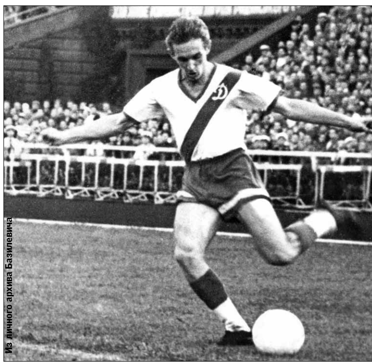
Союз. С «Динамо» стал чемпионом и как игрок, и как тренер

Когда умерла мама, вылепил барельеф. Помогало справиться с горем