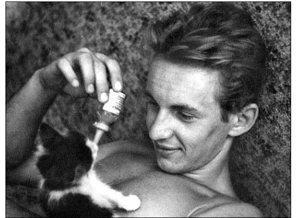
Молодые годы. В основе ДК дебютировал в 19 лет