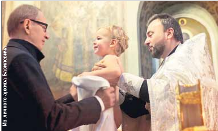
Крестный. «Отец малыша — бизнесмен, мама — научный сотрудник»