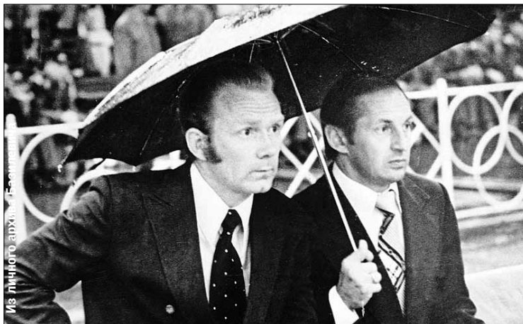
С Лобановским. «Два старших тренера в команде — уникальный эксперимент»