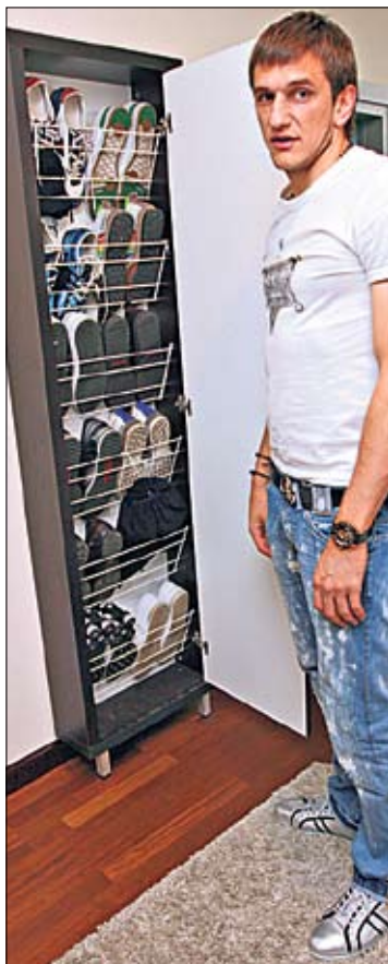
«У меня около 20 пар кроссовок»