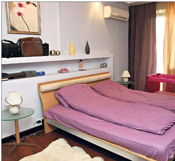
Спальня. Жена и дети футболиста передут в Киев этим летом