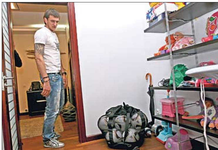
Детская. Игрушки и сетка с настоящими мячами Лиги Европы