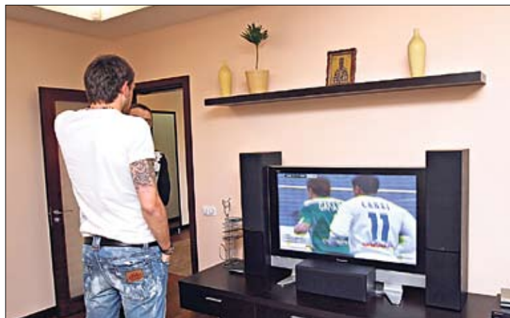
Икона над ТВ. «Ее подарили боснийцы, которые учатся в Лавре»