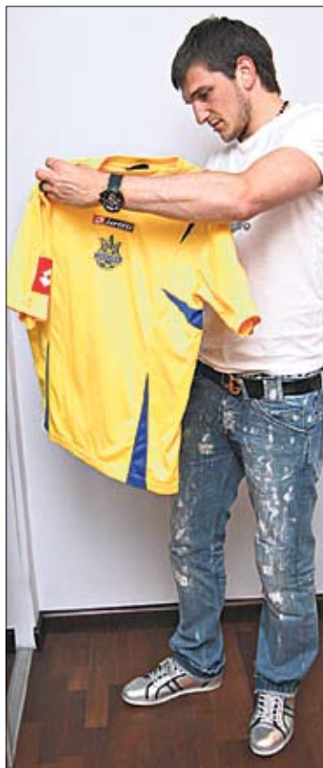
Сб. Украины — подарок от фана