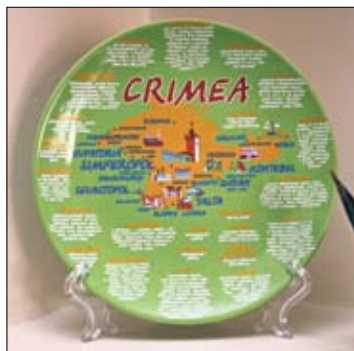
Из Крыма привез тарелочку

таль, который играл в Греции, а сейчас выступает в бельгийском «Стандарте». Я крестил его дочь. Я купил там крестик, который у меня на шее, и еще один, который в моей машине. Очень много счастья случилось за два года после посещения того храма — все хорошо, все получается, я перешел в «Динамо».