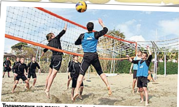
Тренировки на песке. Волейбол «Оболони» пришелся по душе

Довольно дорого, что часто неоправданно. Есть сомнения, что испанские сборы по соотношению цена/качество себя оправдывают. Все-таки курорты зимой должны стоить дешевле, а на Пиренеях зачастую не так. Нужна шенгенская виза. В Испанию из наших чаще всего летают «Шахтер», «Динамо» и запорожский «Металлург».