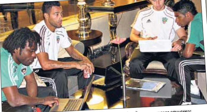
Вечерний отдых. Легионеры «Терека» бродят по интернету

«Нельзя!» — нырнуть в водичку прямо с бортика. Время между тренировками — либо сон, либо сидят в холле, где хороший wi-fi и общаются с близкими через Skype. Те же экскурсии на турецких сборах крайне редки, даже в выходные: мало кто приехал сюда впервые, смотреть уже нечего. Да и просто передохнуть охота, поваляться на пляже.