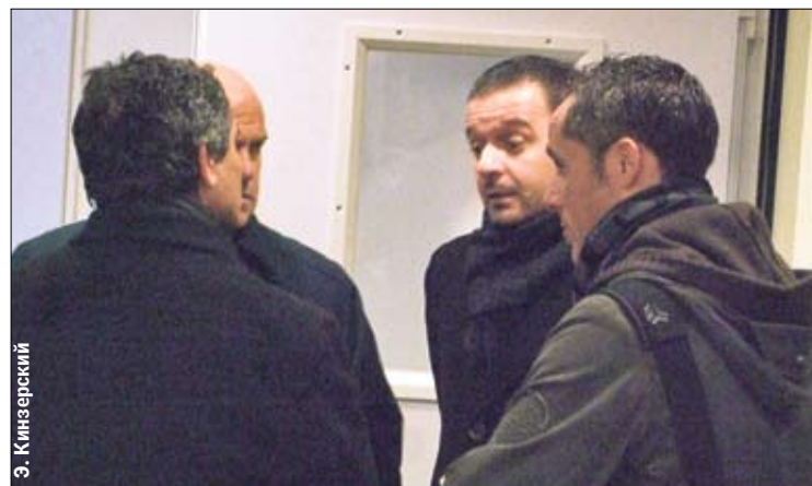
Миятович и Рамос. Возобновляют сотрудничество после «Реала»

■ Выйдя из раздевалки после матча с «Днепром», Срнa направился к импозантному джентльмену в строгом темном пальто и щегольском кашне. Лицо мужчины, с которым капитан «Шахтера» обменялся любезностями на сербско-хорватском, показалось очень знакомым. Так и есть — сам Предраг Миятович! Легендарный в прошлом форвард «Валенсии», «Реала» и «Фиорентины», а позднее — спортдиректор королевского клуба — в разговоре с нами с готовностью предается воспоминаниям: «Мой победный гол «Ювентусу» в финале ЛЧ-98? Это забываемо. Саленко? Конечно,