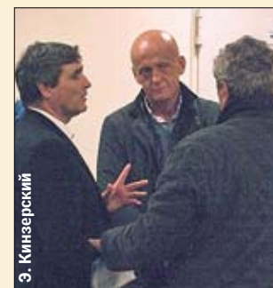
Рамос, Коллина и Луческу быстро нашли общий язык