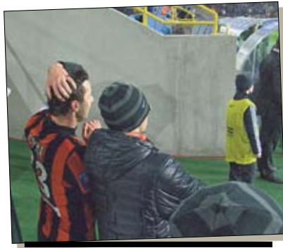
Удаленный Срнa не ушел в раздевалку, а переживал напряжение последних минут вместе с партнерами

горячее становилось на поле. Когда резервный арбитр Можаровский поднял табличку, указывающую, что к основному времени добавлено пять минут, это словно стало сигналом к тому, что именно сейчас и начинается все самое интересное. Почти тут же