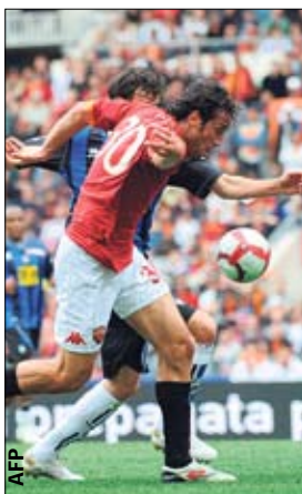
«Рома» вырвалась в лидеры

ГЕРМАНИЯ. «Шальке» неожиданно уступил в Ганновере и предоставил «Баварии» отличный шанс оторваться в таблице. Но полуфиналисты ЛЧ, как, к слову и «Интер», сыграли только вничью с «Байером»