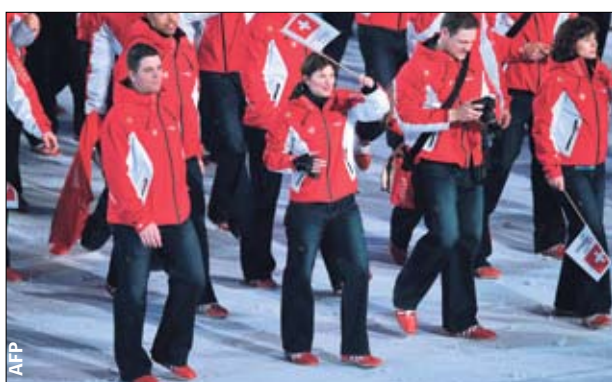
По-простому. Швейцарцы явились в джинсах

Отмашка ■ Огонь на открытии Игр зажегся не со всех сторон. Организаторы этому даже рады