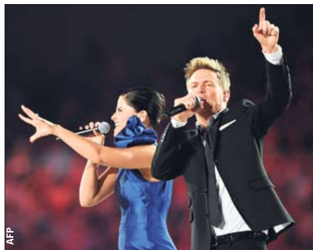
«Ударь в барабан». Нелли Фуртадо и Брайан Адамс