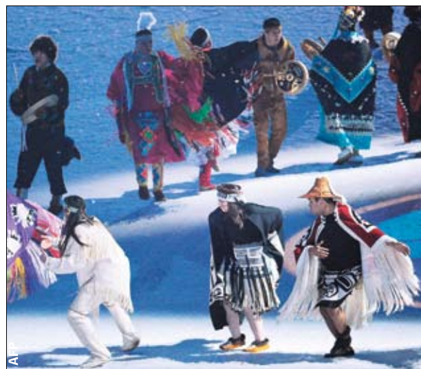
Первые Нации. Аборигенов в Канаде больше миллиона