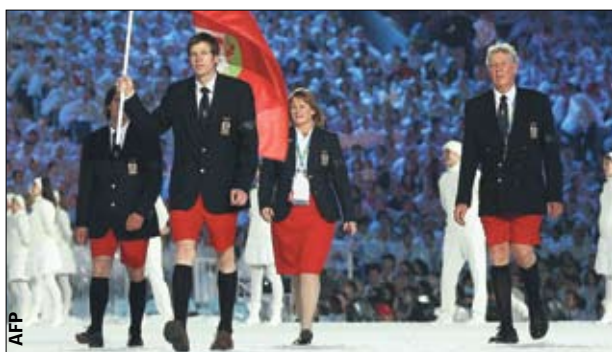
Смелчаки. Бермуды — в национальных шортах