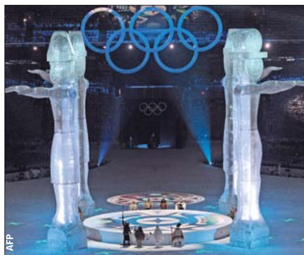
Завораживает и раздражает. Красиво, но медленно