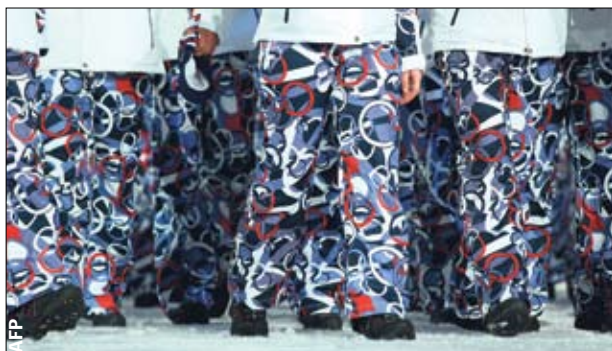
Хит парада. Самое яркое — штаны делегации Чехии