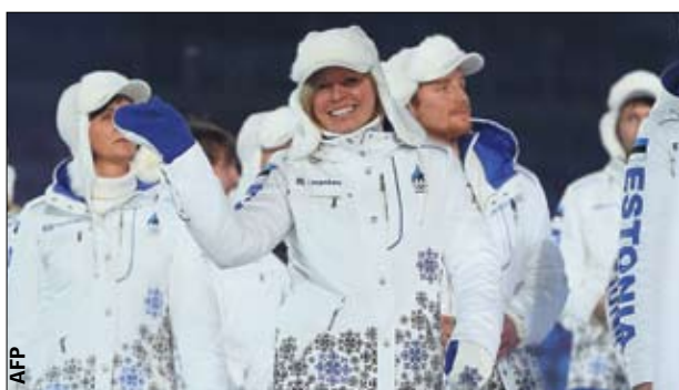
Самые красивые. Куртки и шапки делегации Эстонии