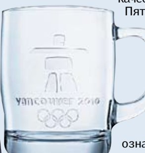
МАТЕРИАЛЫ ПОДГОТОВИЛИ ЛЮБОМИР ЛУКАНОК, ОЛЕГ ЛЮЛКА, АЛЕКСЕЙ ПОНОМАРЕНКО, ОЛЕГ СИВАК, СТАНИСЛАВ ШКАПА

Называется она «инукшук», сделана из цельного арктического камня. А реальный инукшук — это высокое сооружение из камней в форме человеческой фигуры. Аборигены севера Америки использовали их в качестве указателей (обозначали владения, хранилища пищи и т.д.), а организаторы Олимпиады — в качестве эмблемы. Пятицветного человека-инукшука в логотипе Игр зовут Иланаак, на языке народности инуит это означает «друг».