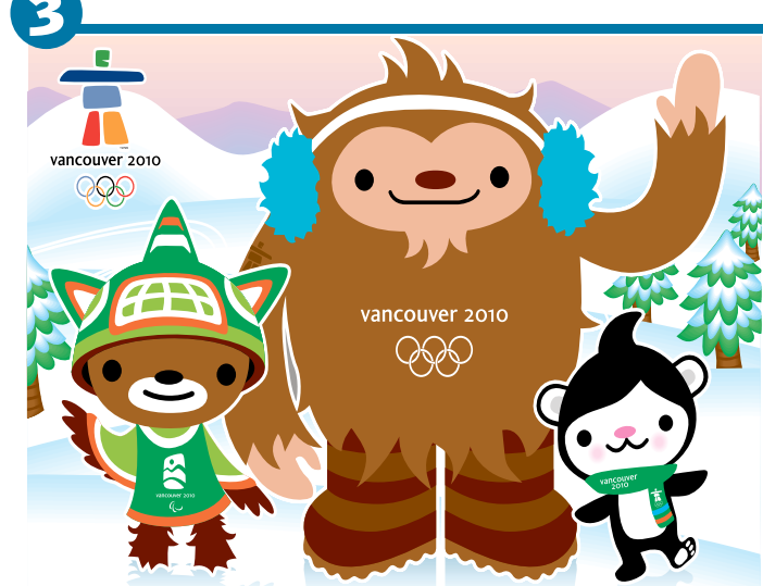
ТАЛИСМАНЫ ЗИМНИХ ИГР-2010