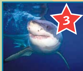
Поплывать в клетке в океане с белыми акулами в Гансбае (это к востоку от Кейптауна). Когда 6-метровая зубастая махина проплывает мимо тебя, ты понимаешь, что такое настоящий страх.