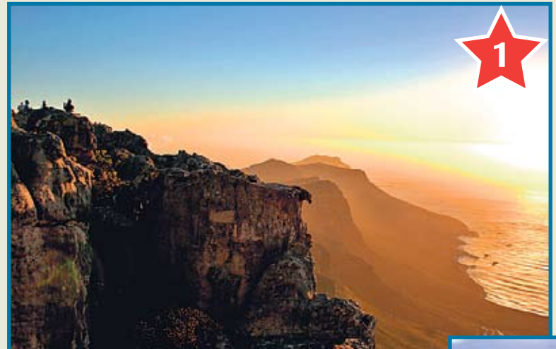
Подняться по канатной дороге на Столовую гору в Кейптауне. Потрясающий вид на город и на океан.

Если поехать на футбол своим ходом, то расходы можно сократить до $2500 (включая перелет МАУ) на человека плюс те же $2000 на «текучку» и экскурсии.