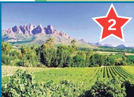
Проехать по винному пути около Кейптауна, попробовать местного вина.