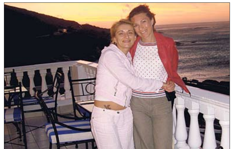
Наши в ЮАР. Говорят, что серьги у них на улице не срывают

Если же машина остановится, то могут быть неприятные инциденты. Здесь не принято ходить пешком. Наиболее проблемным выглядит Йоханнесбург — там очень много бедных кварталов. Самые безопасные — Кейптаун, Порт-Элизабет, Блумфонтейн, Рандбург. Между городами чемпионата перемещаться можно на автомобиле, поезде и самолете. Поезд дороже самолета. Самый распространенный и дешевый способ — автомобиль. Учитывайте, что в июне в ЮАР — зима и холодно. Ночью возможны заморозки. Следует взять с собой куртку и ботинки. Еда в ЮАР вкусная, порции большие. Недорогой хороший обед стоит $5–10. Рекомендую попробовать отличные южноафриканские вина».